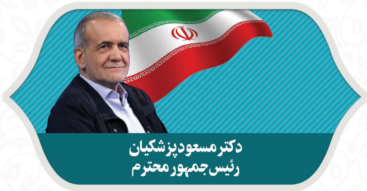
دکتر مسعود پزیشکیان رئیس جمهور محترم